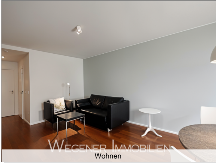
WEGENER IMMOBILIEN Wohnen