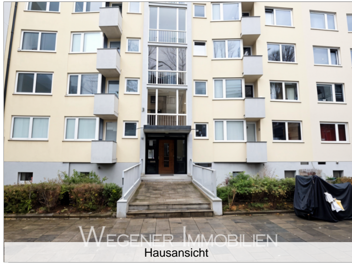
WEGENER IMMOBILIEN Hausansicht