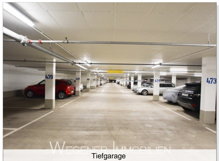
WEGENER IMMOBILIEN Tiefgarage