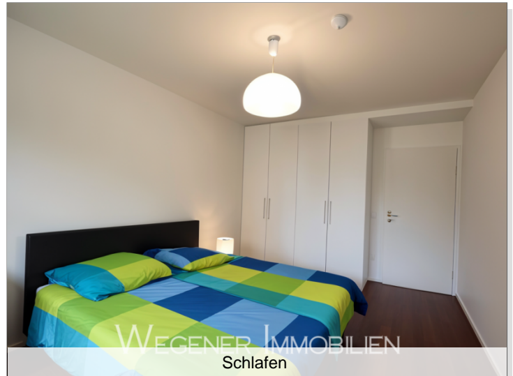
WEGENER IMMOBILIEN Schlafen