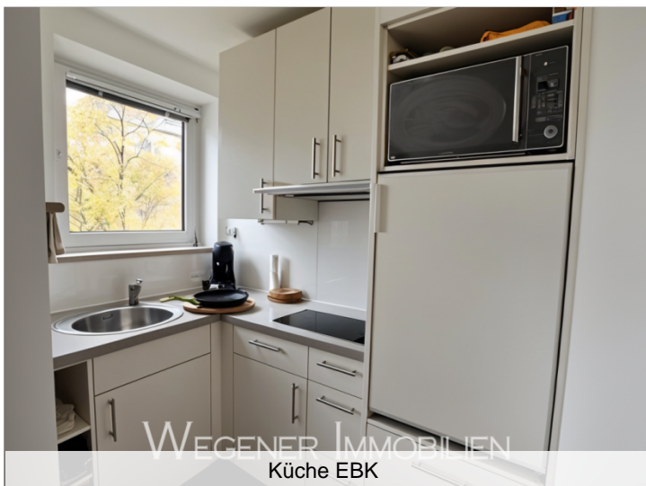
WEGENER IMMOBILIEN Küche EBK