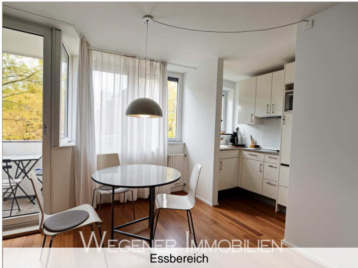
WEGENER IMMOBILIEN Essbereich