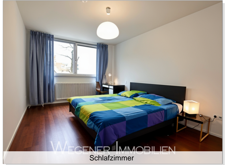
WEGENER IMMOBILIEN Schlafzimmer