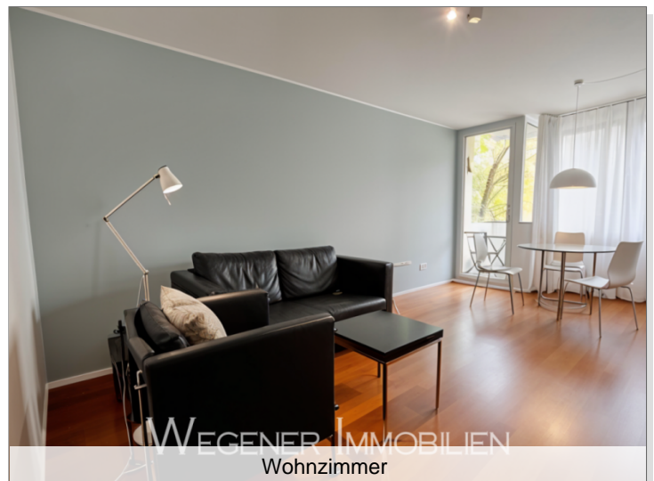
WEGENER IMMOBILIEN Wohnzimmer