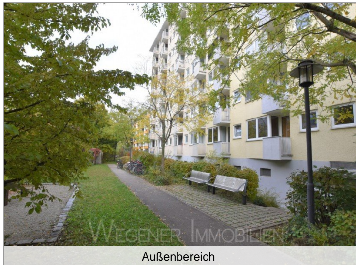
WEGENER IMMOBILIEN Außenbereich