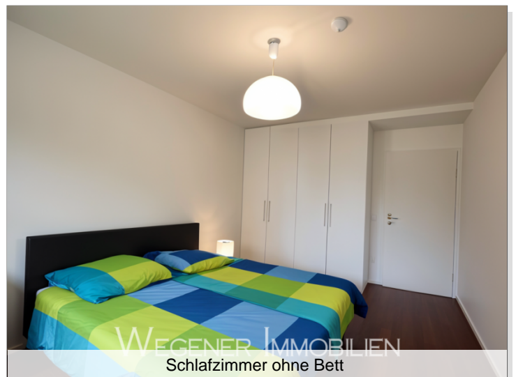
WEGENER IMMOBILIEN Schlafzimmer ohne Bett