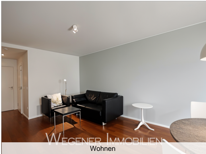
WEGENER IMMOBILIEN Wohnen