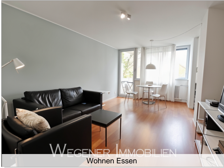
WEGENER IMMOBILIEN Wohnen Essen