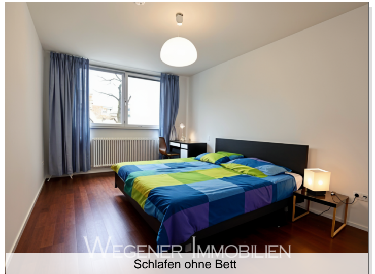
WEGENER IMMOBILIEN Schlafen ohne Bett