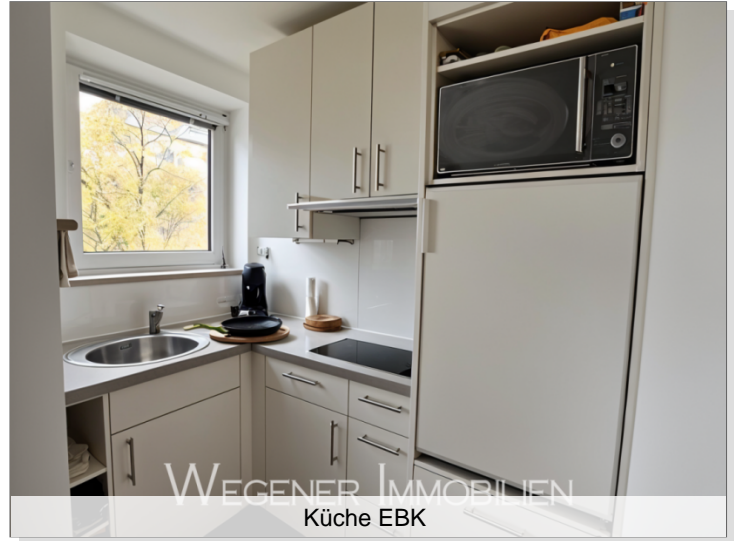
WEGENER IMMOBILIEN Küche EBK