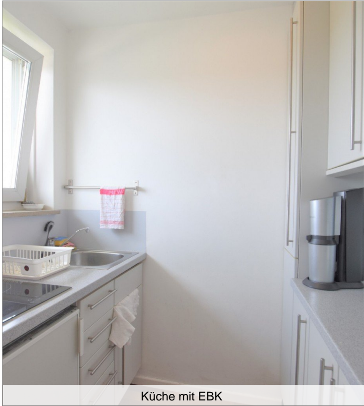
Küche mit EBK