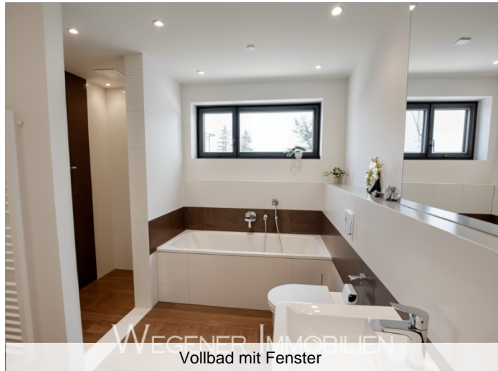
Vollbad mit Fenster