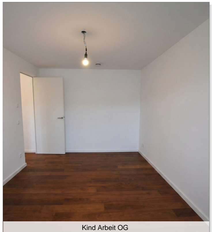
Kind Arbeit OG