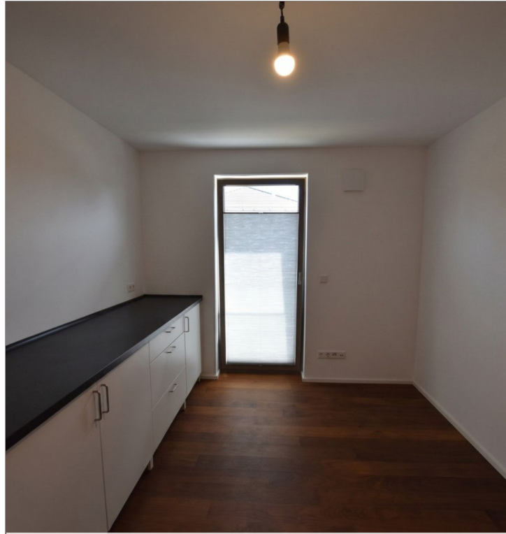
Arbeit Kind OG